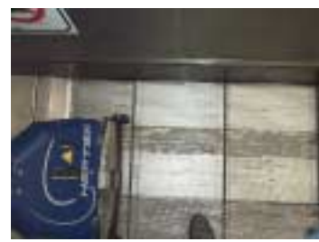
Resultat efter rengöring