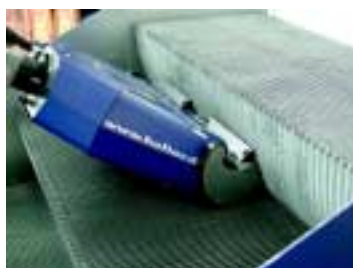
Rengöring av riller