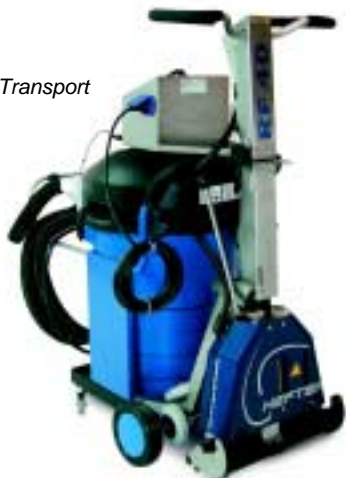
RF 40 Transport