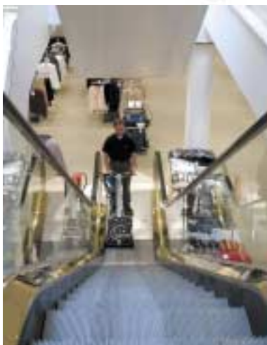
Rengöring av trappsteg