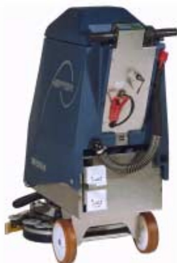
Helgjuten plast tank