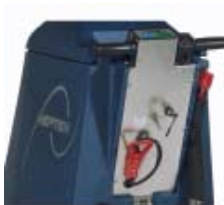
Integrerad kontroll panel