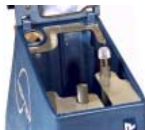
Stora separata tankar för smuts och renavatten