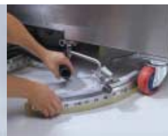
Enkelt att ta bort och göra rent sugskraporna