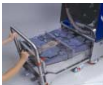
Batteribyte på några sekunder