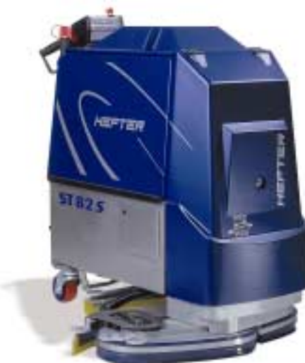
ST82 S VARIOTECH®