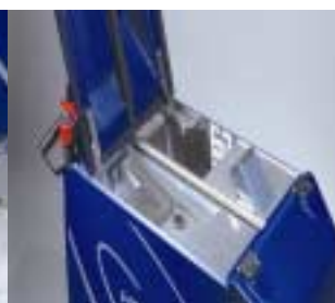
Stor tank med flexibelt membran för smutsigt och rent vatten