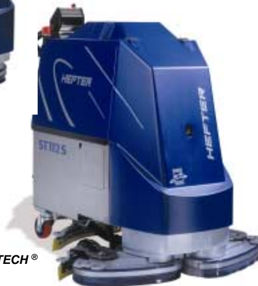
ST112 S VARIOTECH®